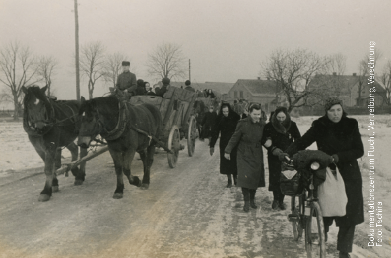
Dokumentationszentrum Flucht, Vertreibung, Versöhnung