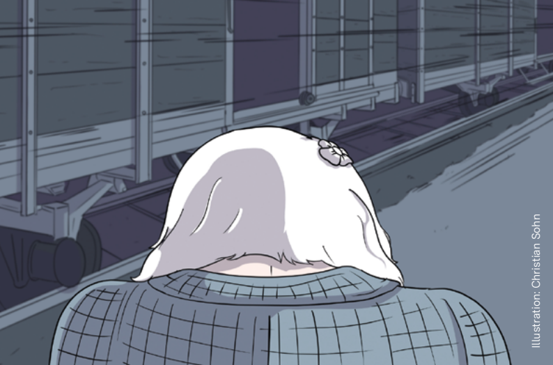
Illustration: Christian Sohn

Künstlerische Darstellung der Großmutter Christian Sohns in Gedenken an die Vertreibungen 1946